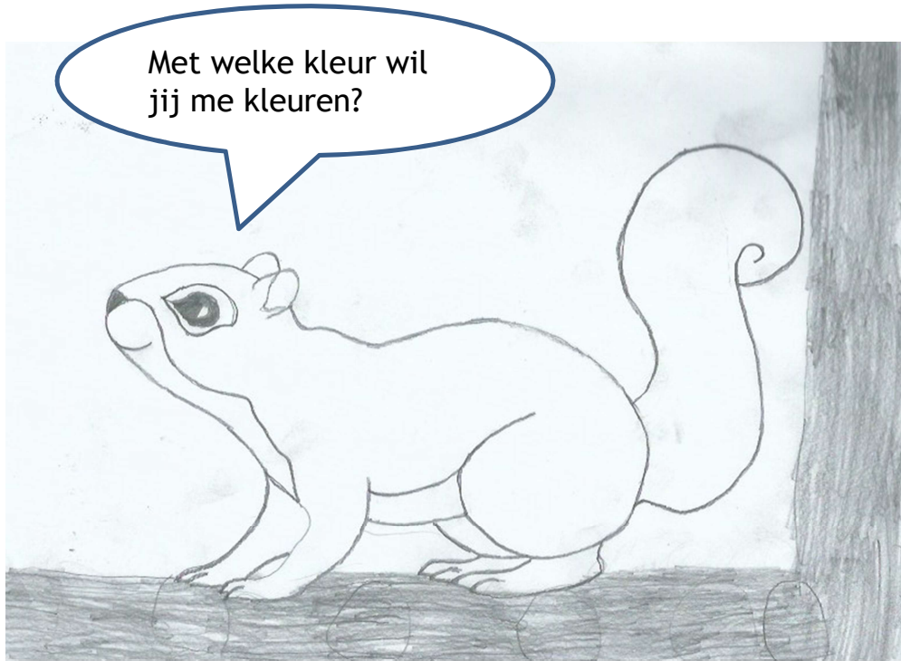
Tekening van Jits (8 jaar)