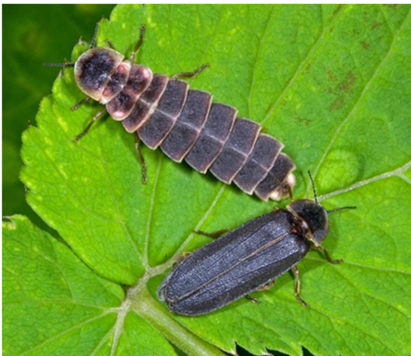
Vrouwte (boven) en mannetje Grote Glimworm

Tussen mei en juli worden de meeste dieren volwassen. Dan eten ze nauwelijks nog en concentreren ze zich op hun laatste en belangrijkste taak, de voortplanting.