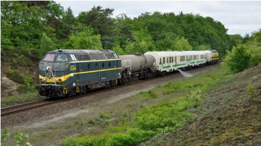
Onkruidtrein van Infrabel