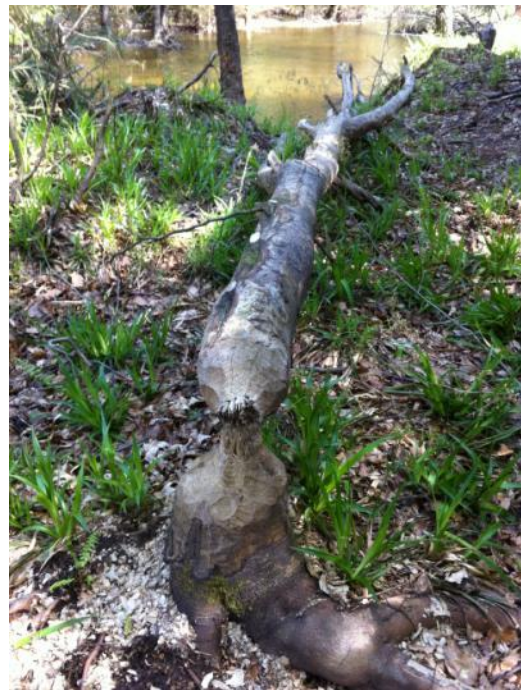
Foto 5: De ingang van een verlaten beverburcht (links) en andere getuigenissen van de bever

Na een terrasje in de namiddag trekken we nog even naar de uitkijktoren op het plateau van St-Hubert. De zon valt zachtjes en een hinde graast voorzichtig in het gras, langs de bosrand wandelt een everzwijn tussen de verjonging van naald- en loofhout... Maar de bever laat me niet meer los. Hij speelt een cruciale rol in het herstellen van de biodiversiteit, het herinitiëren van structuurvariatie en speelsheid, een noeste bos- en natuurbouwer, met een snelheid alsof hij 24 uur op 24 werkt. Op de vraag of er nog wildernis bestaat kan ik u volmondig ja antwoorden, ondanks dat er steeds invloed en grote druk is van de mens, maar wat dit kleine zoogdier voor mekaar krijgt is wonderbaarlijk om zien. Dit avontuur smaakt naar meer!