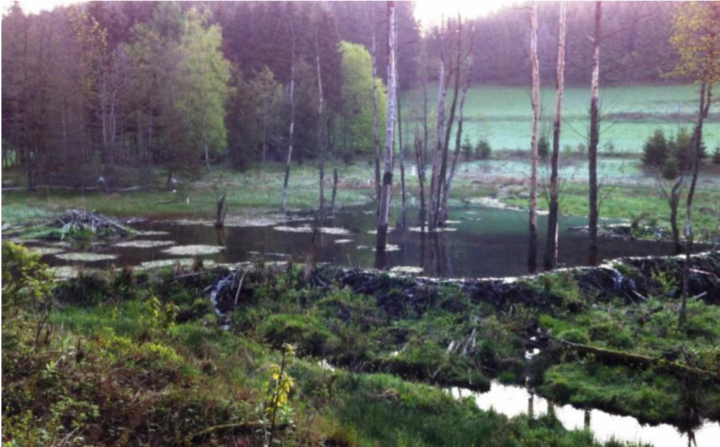
Foto 4: "Beaver paradise" in Chabrehez, getuigenis van dynamiek en veerkracht; een beverdam in lusvorm en links op de foto een burcht