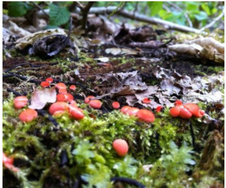
Foto 3: Verse spaanders en knaagsporen van de bever (links) en de boomwratjes op dood hout (rechts) langs de Ourthe

Zondagochtend, 13 mei: Om 5 u worden we uit de sofa gelift, onze veren kraken, buiten is het koud. Er hangt veel nevel rond Houffalize, de koplampen van de auto banen ons een weg door het donker en plots uit het niets worden een vos en drie edelherten tevoorschijn getoverd, we zijn direct wakker. De tweede auto blijft veel langer stilstaan, er is grote belangstelling voor een das! Ditmaal lokt de vroege wandeling ons naar “beaver paradise” in Chabrehez, moerassige weilanden die omgetoverd zijn tot een speelparadijs van de bever. De damconstructie is anders dan bij de vorige locaties en strekt zich als een ronde lus uit over het weiland. Meermaals werd de dam gesaboteerd door ontevreden mensen maar met de nodige veerkracht binnen enkele dagen terug heropgebouwd. De natuurlijke dynamiek en variatie die ontstaan rond de dam en burcht zijn indrukwekkend.