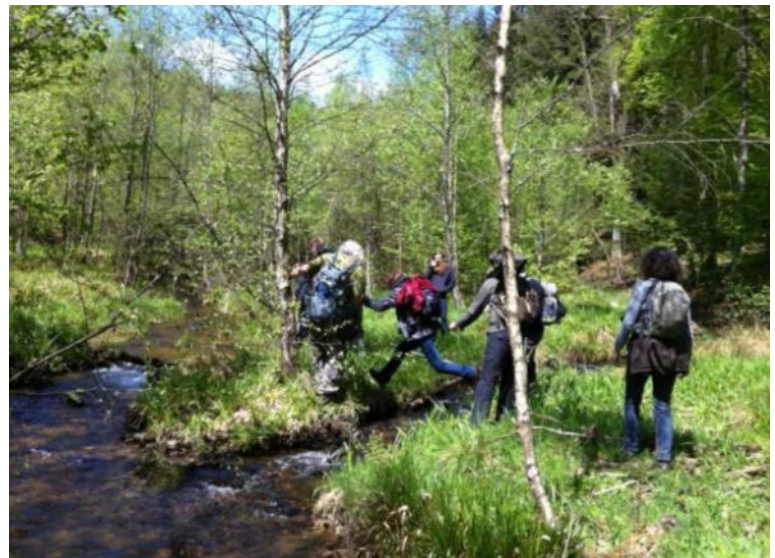
Foto 7: Een doorgebroken dam (links), swingen door een elzenbroekbos (rechts)