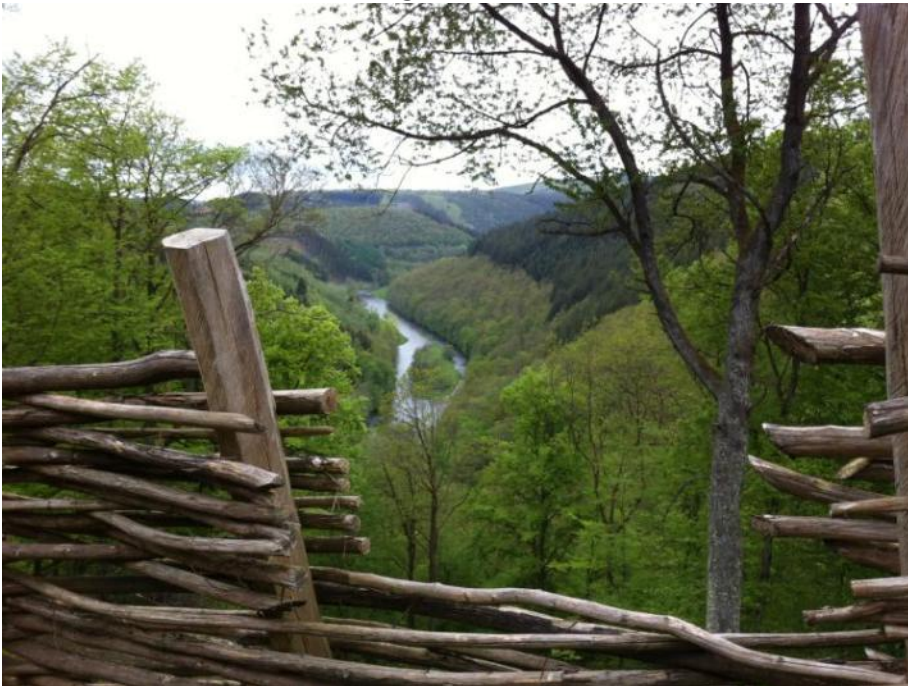
Foto 2: Uitzicht over de vallei van de Ourthe vanuit een Keltische site

Zaterdag, tussen de twee wandelingen in Chevril, meanderen we in de voor- en namiddag doorheen het natuurgebied “Les deux Ourthes”. Bovenaan de vallei wacht ons een archeologische Keltische site en worden we getraakteerd op een schitterend uitzicht. Hoe zouden onze Keltische voorouders samengeleefd hebben met de bever?