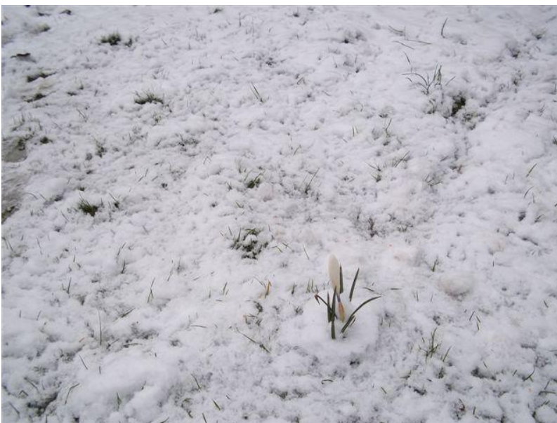
ondanks de sneeuw boort de krokus er zich door!