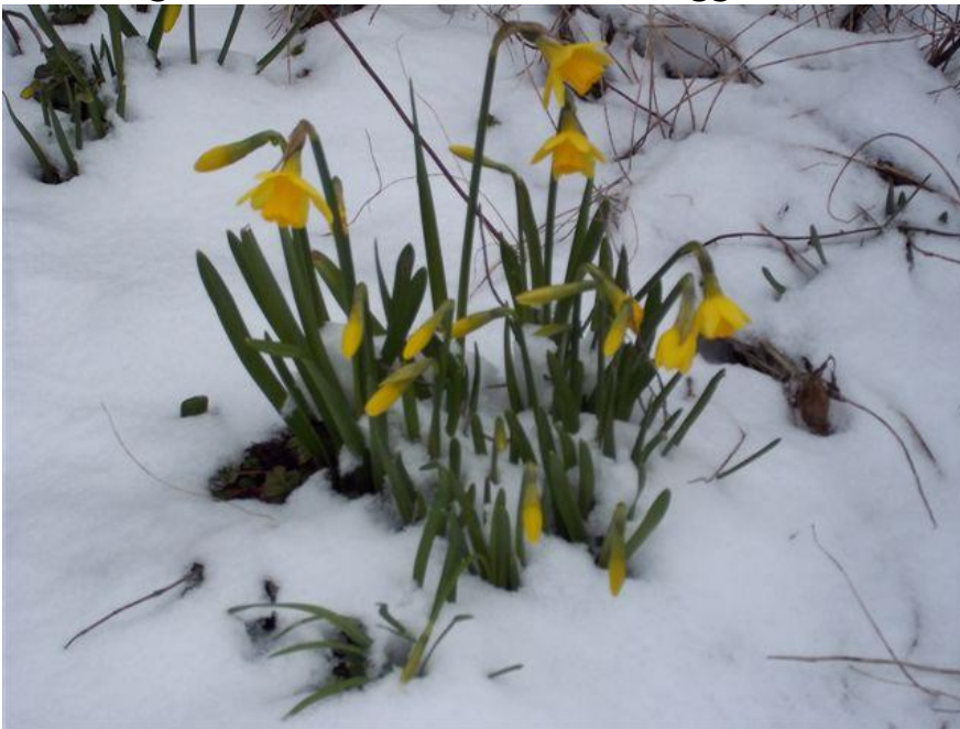
paasbloemen in de sneeuw