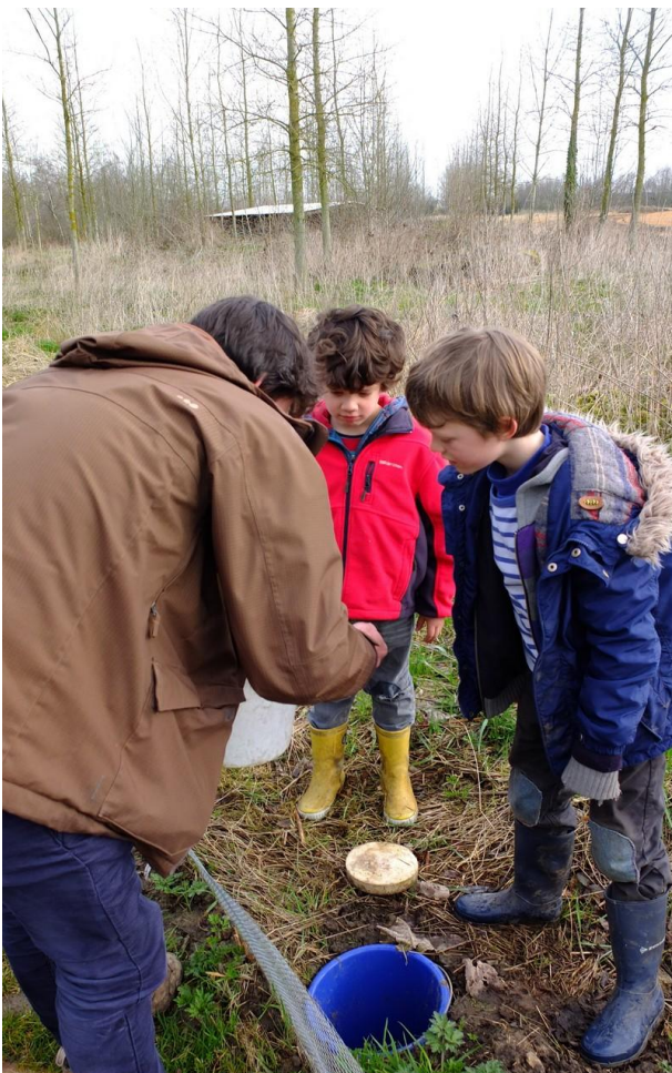
Padden overzetten aan Hoek ter Hulst

Vorige keer had ik hier qua timing “februari-maart” geschreven. Dit was echter buiten koning winter gerekend. Zoals eerder gezegd is de paddentrek dit jaar serieus opgeschoven, waardoor er momenteel nog piektrek is. Naast een overzet in de Lembergstraat, hebben we dit jaar in extremis, op aangeven van een buurtbewoner, ook een paddenscherm opgesteld in Hoek ter Hulst.