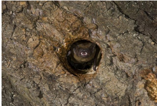
Figuur 1: een baltsende Rosse Vleermuis roept vanuit een holle boom

Met deze speciale 'werfroep' maken ze hun territorium kenbaar en proberen zo passerende vrouwtjes te lokken en tegelijk rivalen op afstand te houden. Soms verdedigen ze hun terrein met hand en tand door 'luidruchtige' gevechten. In de uren voor zonsopgang roepen ze het sterkst omdat de vrouwtjes dan massaal terugkeren naar hun slaapplaats. In hun parkwartier vormen ze zogenaamde paar-gezelschappen, die uit maximum tien steeds wisselende vrouwtjes bestaan. Soms worden die paargezelschappen ook 'harems' genoemd maar aangezien de vrouwtjes actief deelnemen en zelf kiezen welke mannetjes ze opzoeken klopt deze benaming niet echt. De vrouwtjes worden immers niet vastgehouden in zo'n paargezelschap.