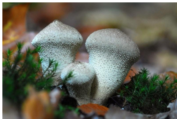
Parelstuifzwammen ( Lycoperdon perlatum )