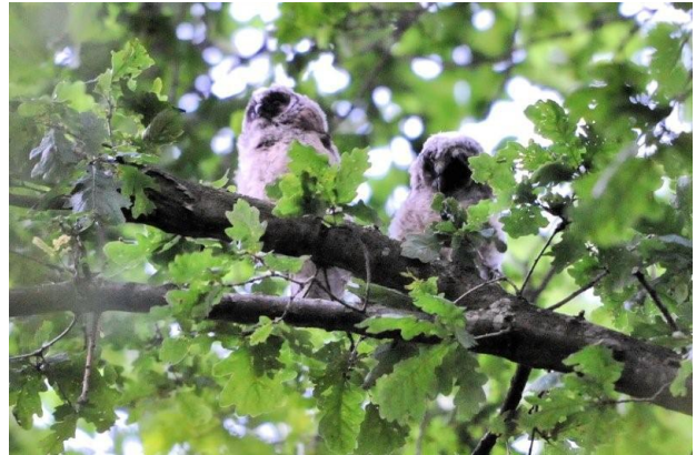
Pas uitgevlogen ransuiltjes