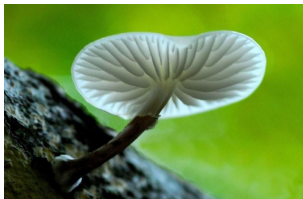
Porceleinzwam ( Oudemansiella musida )

Vroeger hadden wij een koppel ransuilen ( asio otus ) in de tuin. Toen we echter 2 jaar geleden onze grote bomen hebben gesnoeid verdwenen ze. Maar nu ze in de nabijheid van ons woonhuis 2 bossen volledig hebben gekapt, keerden onze vroegere 'nachtwakers' terug.