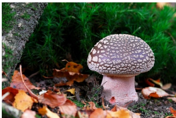
Grauwe amaniet ( Amanita excelsa )