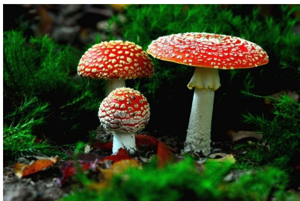
Vliegenzwammen ( Amanita muscaria )