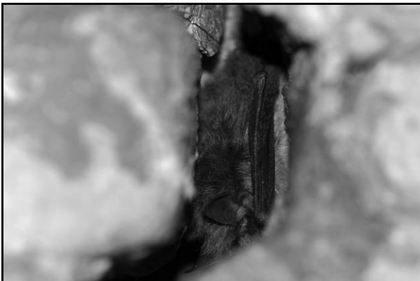
Figuur 5: Watervleermuis houdt z'n winterslaap veilig in een scheur.

Bijvoorbeeld Grootoren , echte specialisten in het struinen, fladderen dan rond in hun winterkwartier om overwinterende Dagpauwogen of andere insecten gewoon van de muur te plukken. De winterslaap verschilt natuurlijk ook van soort tot soort: zo houdt de Ingekorven vleermuis z'n wintertuk op vaste tijdstippen in een winterkwartier met een zeer stabiel klimaat en slaapt hij gedurende langere perioden. En dat maakt deze soort heel gevoelig voor verstoring. Andere soorten zoals de Grootoren zoeken minder beschutte plaatsen op met schommelende temperaturen en worden af en toe wakker. Ook Dwergvleermuizen durven op een warme winterdag wel eens buiten gaan jagen.