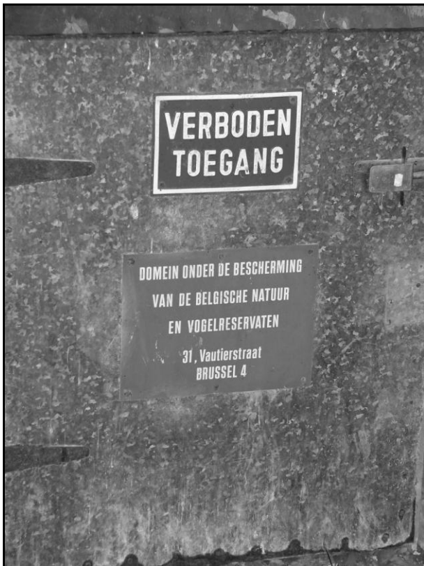
Figuur 6: ijskelderdeur met een bordje van de toenmalige BNVR.

Vleermuizen zijn trouwens echte specialisten op vlak van energiebeheer: ook in de warme jaargetijden passen ze een soort kleine versie van de winterslaap toe, ook wel 'torpor' genoemd'. Bij koel weer houden ze dan hun temperatuur onder de 20°C zodat ze zuinig omspringen met hun energie. Vooraleer ze kunnen uitvliegen moeten ze dan eerst terug op temperatuur komen, net zoals bij het ontwaken uit hun winterslaap.