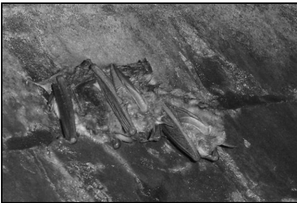
Figuur 1: Twee overwinterende Grootoren samen met een Franjestaart links.

Om het warmteverlies maximaal te beperken verkleinen ze ook hun lichaamsoppervlak door vleugels en staartvlieghuid dicht tegen het lichaam aan te drukken. Grootoorvleermuizen vouwen bijvoorbeeld om die reden ook hun enorme oren op, ze plooiën die dan onder hun voorpoten zoals op onderstaande figuur. Dit schijnt een effectieve bijkomende voorzorgsmaatregel te zijn om bevroeringsverschijnselen te voorkomen want het gebeurt niet zelden dat het oor van een vleermuis beschadigd raakt door vorst.