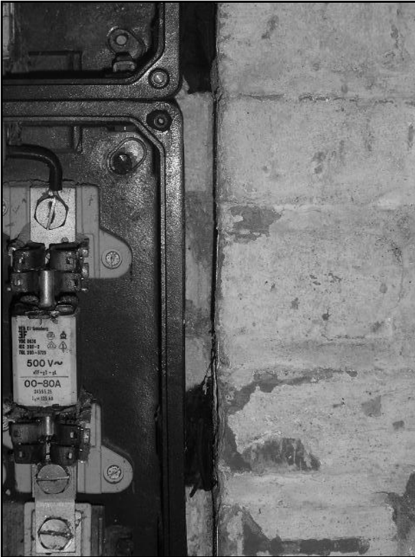
Figuur 2: Overwinterende vleermuizen kan je terugvinden op de meest gekke plaatsen.

Sommige soorten zoals Rosse vleermuizen overwinteren in holle bomen. Daarbij bestaat het gevaar dat bij het ondoordacht kappen van bomen in de winter de aanwezige dieren gedood worden. Verder zijn er ook meldingen van overwinterende Grootoren op kerkzolders.