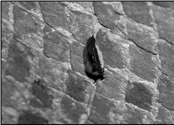
Figuur 4: Winterslapende baardvleermuis hangt aan het plafond van een ijskelder.