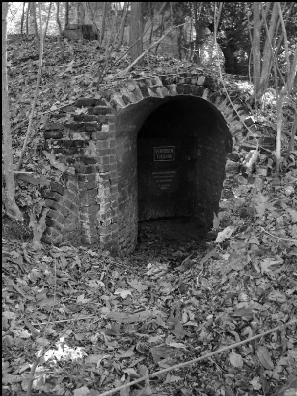
Figuur 3: ingang van een ingerichte ijskelder.

Bepaalde soorten doen de winterslaap solitair, andere soorten in groep en sommige zelfs gemengd met andere soorten zoals te zien is op de foto met de Grootoren en Franjestaart . Dan kruipen ze allemaal dicht bij elkaar: net zoals bij de jongen op de kraamkolonies is dit hier ook een vorm van sociale thermoregulatie. Ook de plek waar ze hangen verschilt van soort tot soort: Hoefijzerneuzen hangen altijd vrij aan het plafond, daarbij slaan ze hun vlieghuid om zich heen als een beschermend deken en sommige soorten kruipen dan weer uitsluitend in spleten waar ze overal lichaamscontact hebben. Nog andere soorten hangen zowel vrij of kruipen in nissen, schachten en spleten met een gunstig microklimaat. Voorbeelden daarvan zijn te zien op figuren 4 en 5.