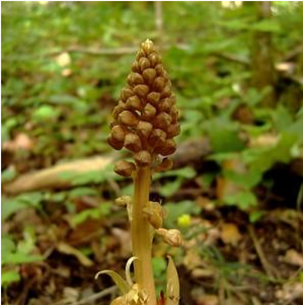
Vogelnestje ( Neottia nidus-avis )