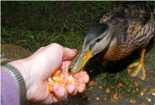
Kwakje komt eten