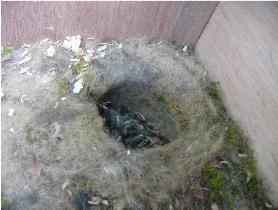
Meesjes in de steenuilkast