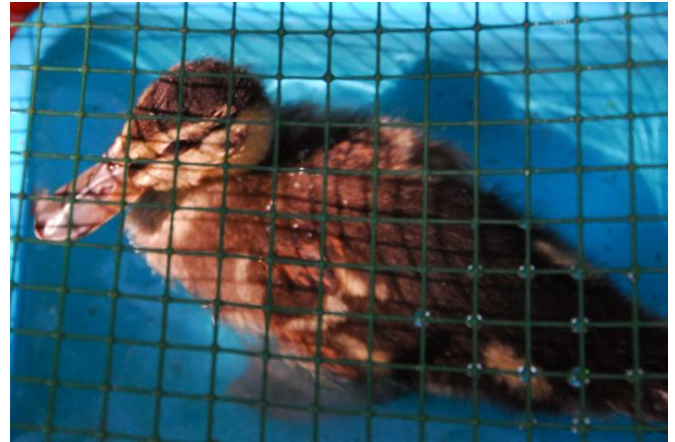
Kwakje in bad

Vanaf dat moment kreeg ik een heel trouw vriendje dat met een mix van versnipperde salade, geraspte wortel en appel, versneden gekookte aardappelen, versneden tomaat, verkruimeld brood en wat korrels visvoeder heel flink opgroeide. Het eendje reageerde alleen op mijn stem en bleef uit mijn hand eten als ik het vroeg, maar ging zich telkens verstoppen als iemand anders in de omgeving kwam. Het verblijf was ondertussen een miniserre geworden die om de twee dagen op ons grasveld werd verplaatst. Het plasticen badje had een overdonderend plonssucces. Het eendje kreeg snel zijn verenkleed en bleef zich kraaknet wassen. Zodra ik verscheen, kwam Kwakje zich heel dichtbij neerleggen en reageerde prompt op elk van mijn woorden met een stil instemmend “glu-glu-glu”. Stel je voor: een volwassen mens op zijn knieën in gesprek met een eend, toch niet te geloven!