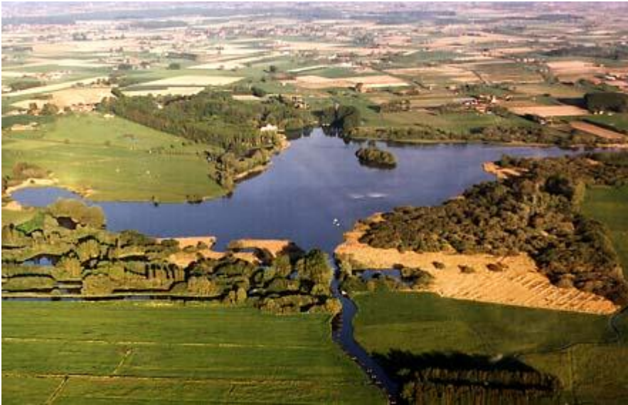
Luchtfoto van het Blankaart-gebied

Afspraak: 10u00 Markt Scheldewindeke voor carpooling