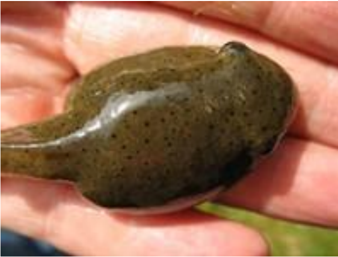
Kikkervisje van de Amerikaanse brulkikker

De stierkikker is niet de enige exoot die op zijn hoede moet zijn. In West- en Oost-Vlaanderen worden de Canadese ganzen massaal afgeschoten. Daarnaast worden hun eieren geklutst, zodat er geen kleintjes uit komen. Dat allemaal om te voorkomen dat ze de inheemse ganzen nog langer beconcurreren en de velden beschadigen.