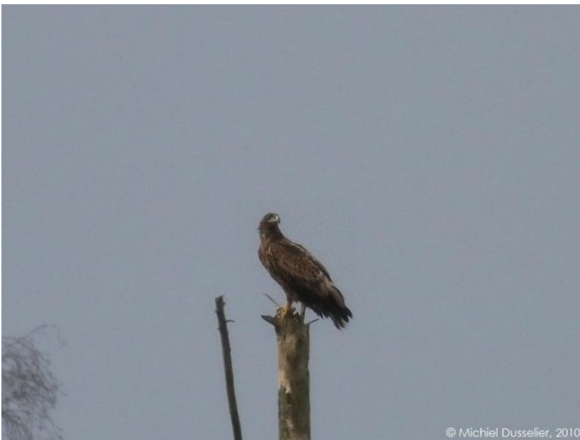
De Zeearend van Oud-Heverlee

Hoe lang het exemplaar in Oud-Heverlee nog te bewonderen zal zijn, hangt van het weer af. "Doorgaans trekken ze bij het begin van de lente terug naar hun oorspronkelijk leefgebied, maar het kan net zo goed dat ze tot april of mei in de buurt blijven".